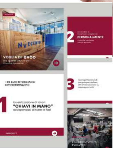
Esempio pubblicazioni social per evoo partner per il 2° numero di HL Magazine - Estate 2022

Per concludere il HL Magazine godrà di un'ottima vetrina digitale, sarà infatti scaricabile in qualsiasi momento dal nostro sito, inviato tramite newsletter a clienti ed iscritti, e promosso tutto l'anno attraverso i vari canali social aziendali: Facebook, Instagram, Telegram, LinkedIn e Wahtsapp. Particolare attenzione sarà dedicata ai publiredazionali promossi tramite post personalizzati sui nostri social.